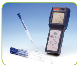
WITT OXYBABY M