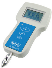
Kikkoman Lumistester PD-10